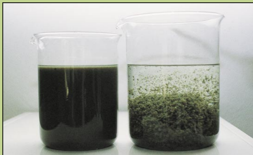
Osad z domieszką polielektrolitu

Obecnie w eksploatacji znajduje się ponad 5000 urządzeń tego typoszeregu.