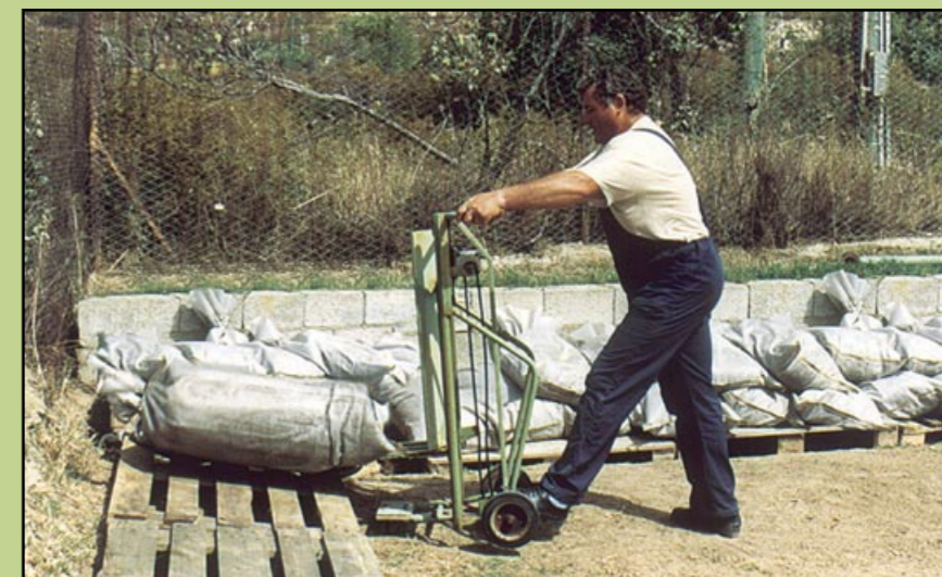
Układanie worków na wolnym powietrzu

Pojedyncze urządzenia mogą być łączone szeregowo lub równolegle, co pozwala na rozbudowę systemu w trakcie eksploatacji.