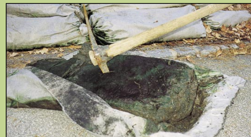
Osad po 3 miesięcznym składowaniu