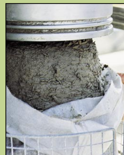
Odwodniony osad po 24 godzinach